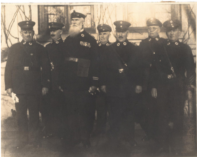
Harburger Sanitätskolonne 1907