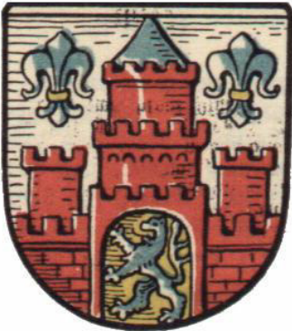
Wappen der Stadt Harburg-Wilhelmsburg

Mit dem Groß-Hamburg-Gesetz kam am 1. April 1937 nicht nur die Stadt Harburg-Wilhelmsburg als eine von drei ehemals preußischen Städten neben Altona und Wandsbek zu Hamburg, auch viele ländliche Gemeinden wurden der neuen Großstadt eingemeindet. Im Süderelbe-Bereich, also aus der preußischen Provinz Hannover, waren dies die vorher zum Landkreis Harburg gehörenden Gemeinden Altenwerder, Finkenwerder (südl. Teil), Fischbek, Francop, Gut Moor, (Hannoversch) Kirchwerder, Langenbek, Marmstorf, Neuenfelde, Neugraben, Neuland, Rönneburg, Sinstorf und Teile der Gemeinde Over aus dem Regierungsbezirk Lüneburg und die Gemeinde Cranz des Landkreises Stade aus dem Regierungsbezirk Stade.