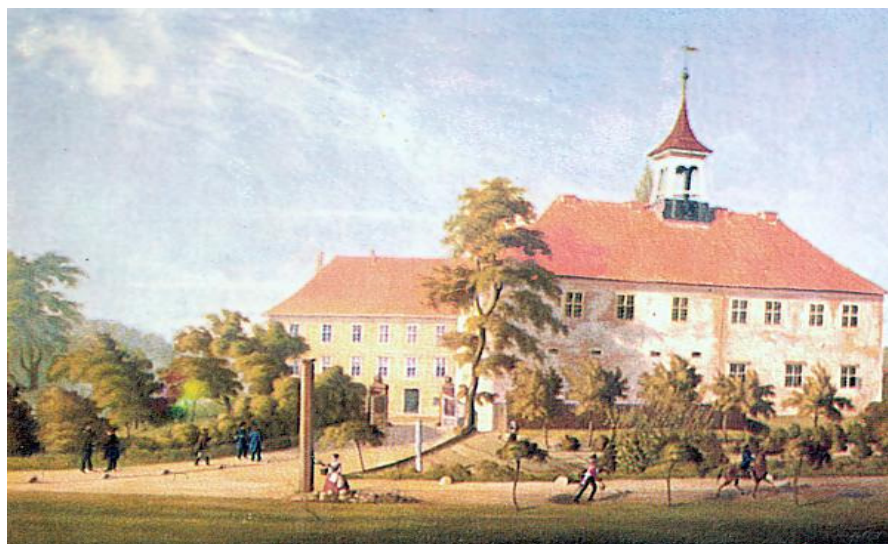
Darstellung des Harburger Schlosses

Durch das Groß-Hamburg-Gesetz ging Harburg-Wilhelmsburg am 1. April 1937 von Preußen an das Land Hamburg über.