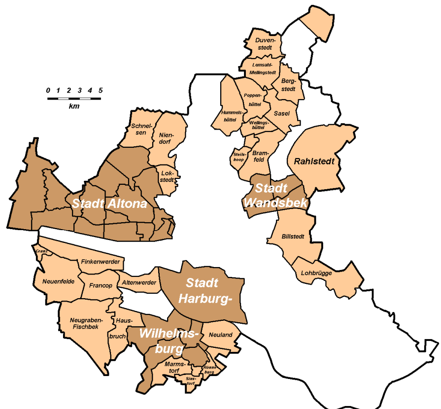
Eingemeindung von Stadtteilen und Gemeinden durch das Groß-Hamburg-Gesetz

deutschen Landesverbände bzw. preußischen Provinzialverbände, darunter ganz Hamburg, wurden zur Landesstelle X zusammengefasst. Innerhalb Hamburgs lehnte sich die Struktur der DRK-Kreisstellen an die der NSDAP an, die wiederum räumlich mit der Struktur der Hamburger Wehrkreise identisch war. Die NSDAP-Kreisleiter waren nunmehr gleichzeitig DRK-Kreisführer. Das Rote Kreuz in Harburg wurde zur Kreisstelle VIII. Die ehemals unabhängigen Sanitätskolonnen wurden zu Bereitschaften, von denen zumindest die in Wilhelmsburg, Neugraben und Neuohfen neben der Bereitschaft Harburg den 2. Weltkrieg noch eine ganze Reihe von Jahren überdauert haben. ■