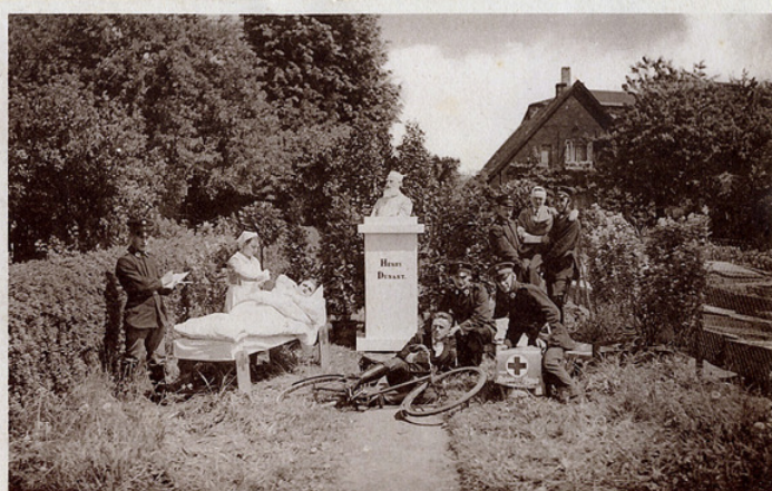
Lebendes Bild gestellt bei der Dunantfeier in der Kolonne Harburg Elbe

In den Anfangsjahren unterstützte die Stadt Harburg die Kolonne über den Zweigverein vom Roten Kreuz durch jährliche finanzielle Zuwendungen und durch die kostenlose Bereitstellung von Übungsräumen, zunächst in der Gewerbeschule, später in der Turnhalle der Dempwolffschule. Bereits mit Ende des 1. Weltkrieges musste die Kolonne für die Raumnutzung jedoch an die Stadt Zahlungen von immerhin 60 Reichsmark leisten. 1937 konnte die Kolonne endlich ein eigenes Kreishaus am Postweg 14 einweihen. ■