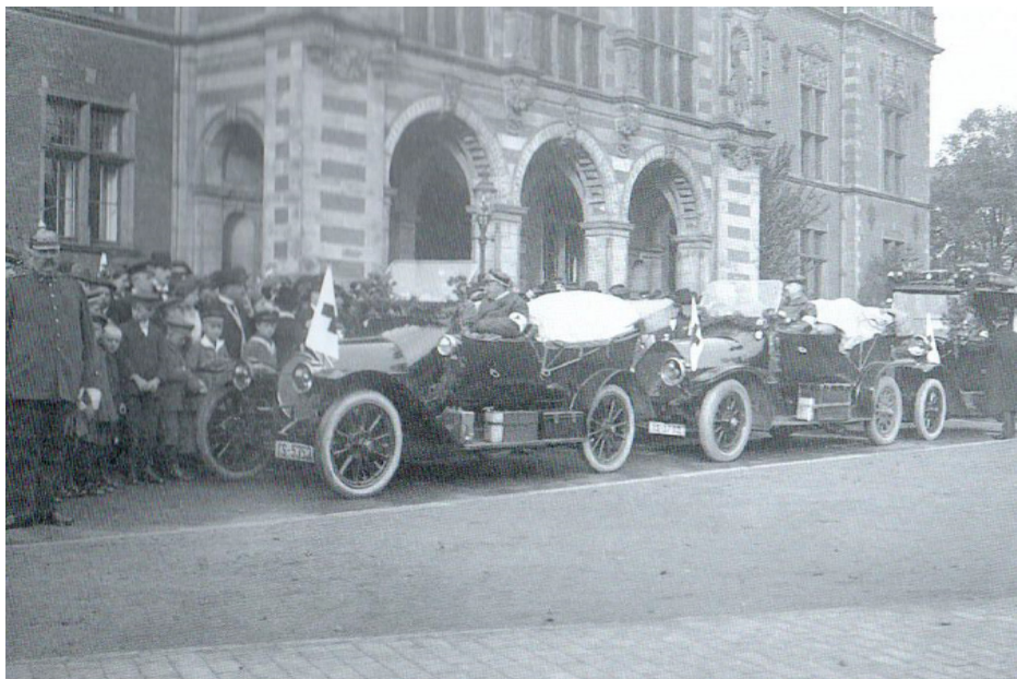
Das Rote Kreuz vor dem Harburger Rathaus am 4. Oktober 1914

im Jahr 1937 zählte diese 120 aktive, 3 inaktive, 10 außerordentliche und 11 Ehrenmitglieder. Dabei ist zu bedenken, dass das Rote Kreuz einen Teil des Mitgliederanstiegs der zwangsweisen Auflösung des Arbeiter-Samariter-Bundes im Jahre 1933 zu verdanken hatte. ■