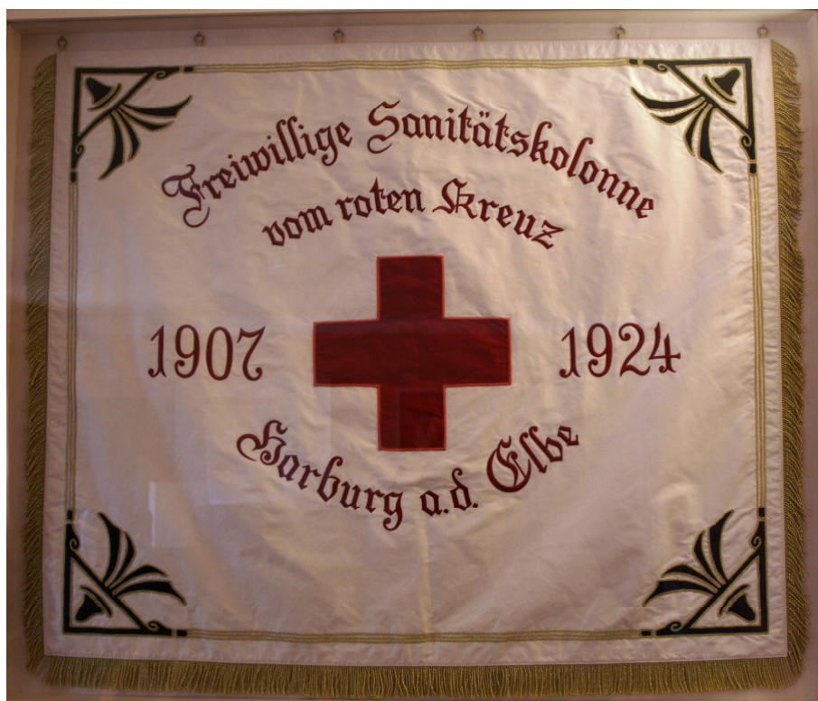
Vereinsfahne der Freiwilligen Sanitätskolonne vom Roten Kreuz Harburg a. d. Elbe