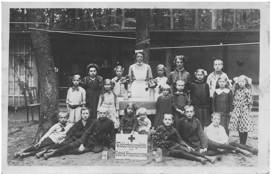
Wahrscheinlich Ferienheim des Harburger Vaterländischen Frauenvereins in der Haake; oder aber auch Walderholungsstätte des Vaterländischen Frauenvereins Altona II. bei Sülldorf/Blankenese, Sommer 1916

In diesem Jahr sind auch infolge an den Verein herangetretener Wünsche, verteilt auf die 4 Perioden, 18 junge Mädchen im Alter von 14 bis 17 Jahren für den Tagesaufenthalt aufgenommen, welchen der Aufenthalt ebenfalls sehr gut bekommen ist. Um