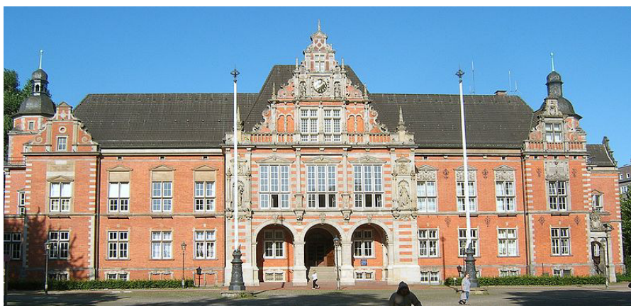
Das Harburger Rathaus

durch Verbindungsdeiche vereinigen ließ, aus dem Landkreis Harburg herausgelöst und 1927 mit Harburg zum Stadtkreis Harburg-Wilhelmsburg mit nunmehr 110.000 Einwohnern vereint.